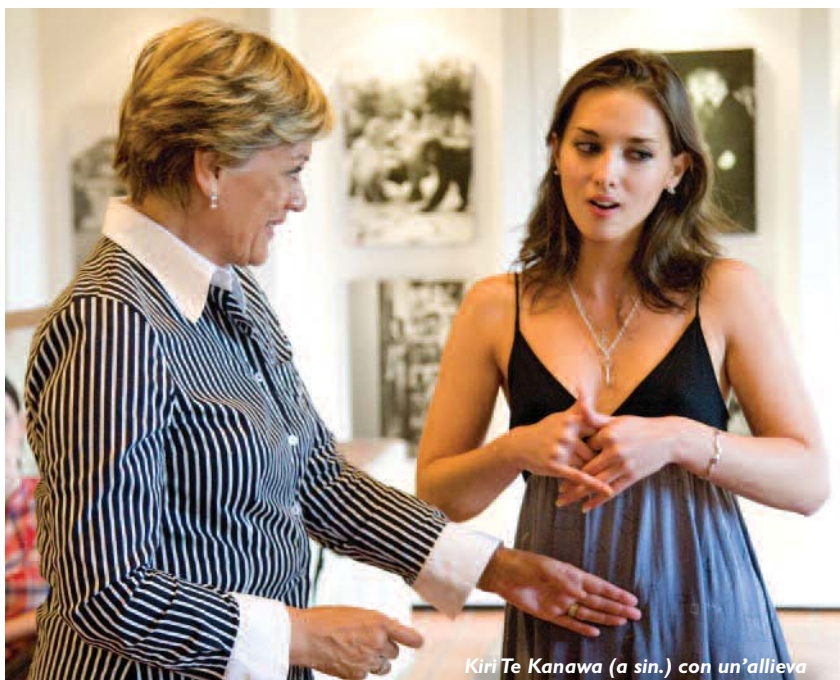
Kiri Te Kanawa (a sin.) con un'allieva

didati davvero notevoli dalla Cina". Gli altri nove cantanti provengono poi da Corea del Sud, Sud Africa, Nuova Zelanda, Australia, Polonia, Lituania, Bielorussia e Gran Bretagna.