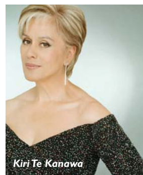
Kiri Te Kanawa