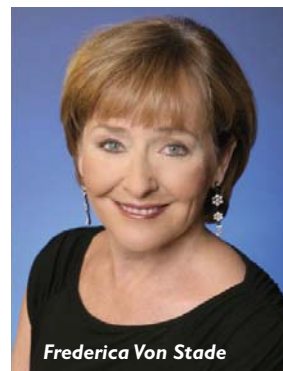
Frederica Von Stade