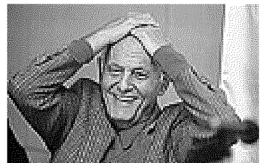
Il maestro Georg Solti